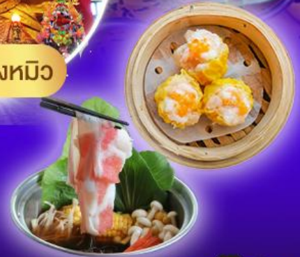
วัดแซกทงหมิว

ทริสเตรี พักผ่อนแหล่ง shopping Tsim Sha Tsui , Mong Kok , Jordan