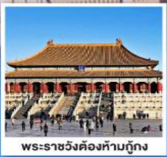
พระราชวังต้องห้ามปักกิ่ง