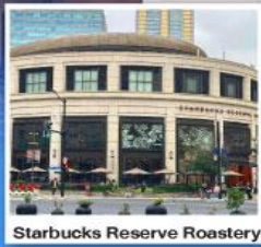
Starbucks Reserve Roastery