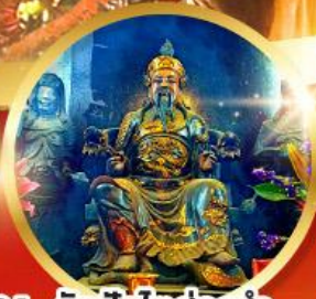
วัดปักไต้ฮ้องฮ่า