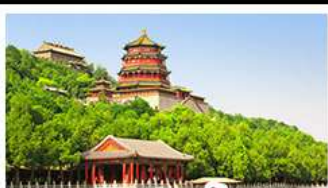
พระราชวังฤดูร้อนอี้เหอหยวน

ท่าแพงเมืองจินด่านจวียงกวน - พระราชวังฤดูร้อนอี้เหอหยวน สวนจิ้งอัน - วัดลามะ - โมลร้านค้าช้อปปิ้ง - โรงแรม 4 ดาว มือพิเศษ เปิดปีกกึ่ง สุกี้มองโกล MICHELIN GUIDE ร้าน TAO TAO JU