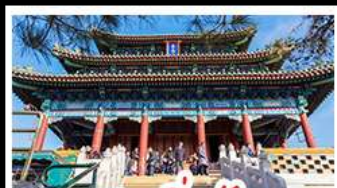
สวนจิ้งอัน