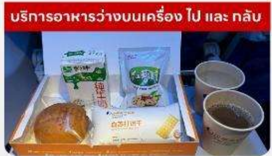
บริการอาหารว่างบนเครื่อง ไป และ กลับ