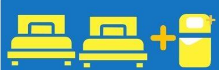
เตียง 3 ท่าน ที่นอนเสริม TRIPLE