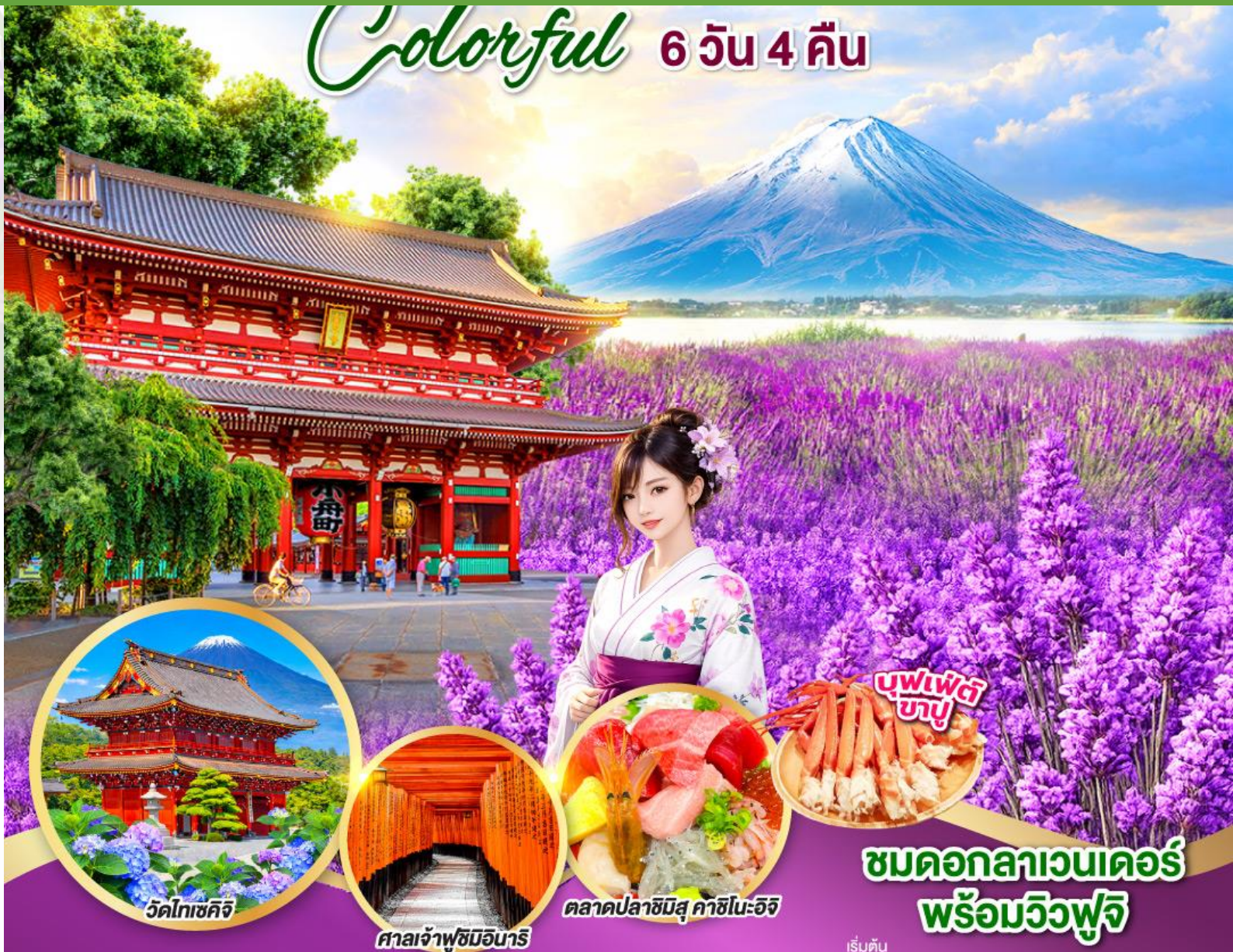
วัดโคจิกิจิ