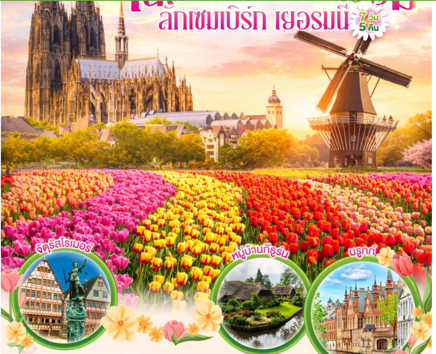
จัตุรัสโรเมอร์