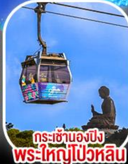
กระเช้าเองปีง พระใหญ่โป่วหลิน