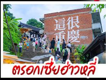
ตรอกซี้ยฮ่าวหลี่