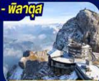
ยอดเขาพิลาทุส

นั่งรถไฟ Bernian Express เส้นทางรถไฟสายมรดกโลก