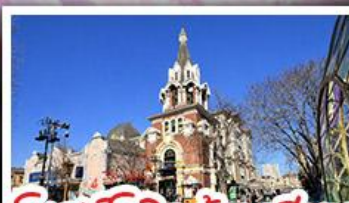
โบสถ์โกธิคต้าเหลียน