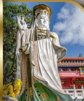
เจ้าแม่กวนอิม ริพลีสเบย์