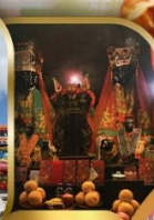
วัดบ้านใหม่