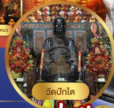
วัดปักไต่