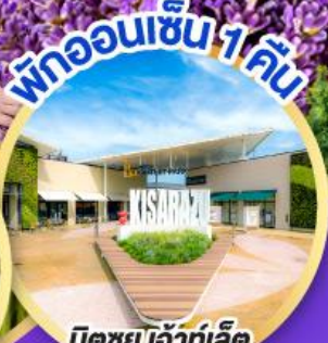
มิตซูโฮะอิเกะ ลีต พาร์ค คิชะระชู