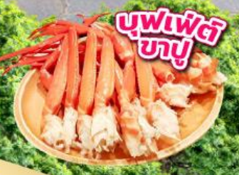
บุฟเฟ่ต์ ซาซึ

เช็คอิน จุดถ่ายรูปมุมมองใหม่ วัดโทเซคิจิ