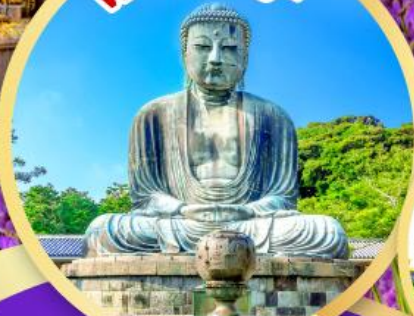
หลวงพ่อโต ไคบุตสึ