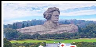
เกาะคัมจิวจี้โจว