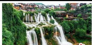
เมืองโบราณผู่เฉงเจิน