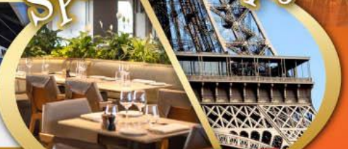
รับประทานอาหารกลางวัน บนหอคอยเฟล

ไฮไลท์ในโปรแกรม • สะพานไมชาเปเล ลูเซิร์น