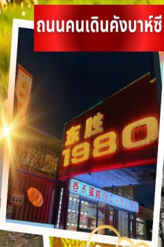
ถนนคนเดินคังบาหิซี