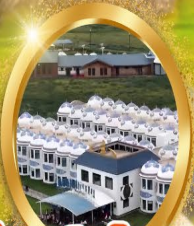
ที่พักสไตล์กรังโฌ