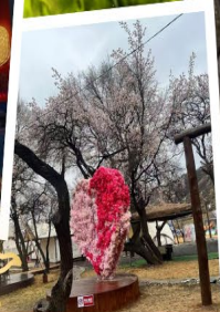
สวนแอปริคอต