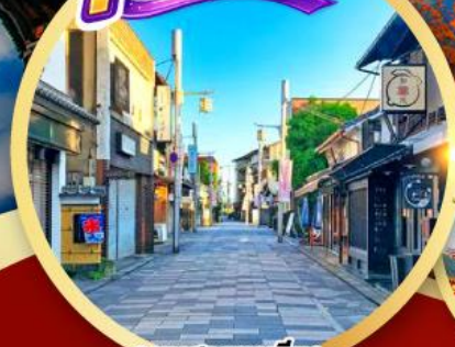
ถนนสายชาเขียว