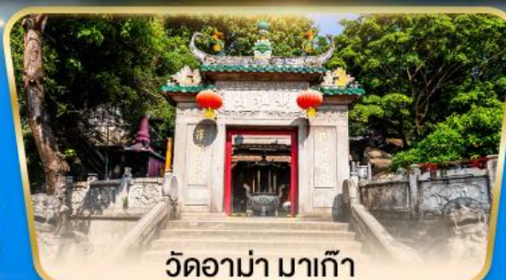
วัดอามา มาเก๊า