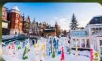
โรงงานช็อกโกแลต ชิโรอิ โคอิบิโตะ