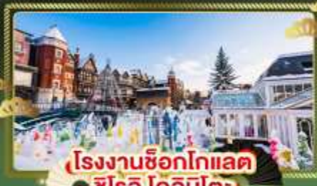
โรงงานช็อกโกแลต ชิโร โคอิจิโตะ