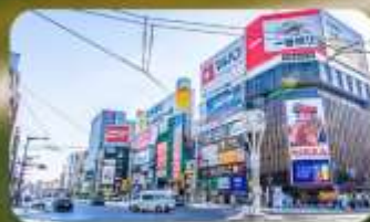
ซูซุกิโนะ