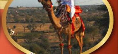
ฟรี ทัชมาฮาล เมืองมันทาวา ราคาเริ่มต้น