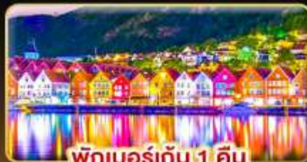
พักเบอร์เกน 1 คืน