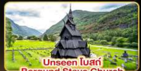
Unseen โบสถ์ Borgund Stave Church