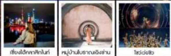
เชียงใหม่คลาสสิกไนท์