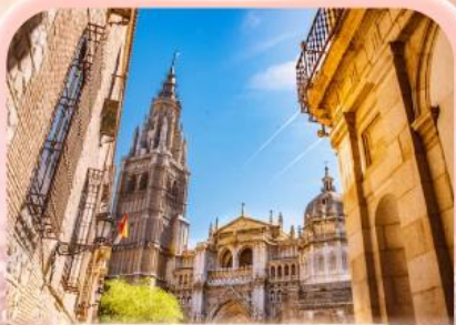
มหาวิหารแห่งโทเลโด

ซาคราเดา ที่ว่ายิ่งใหญ่ ยังไม่เท่าใจ... ที่ให้เธอไปหมดแล้ว