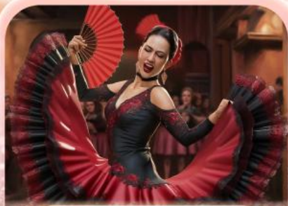
ระบำฟลามิงโก