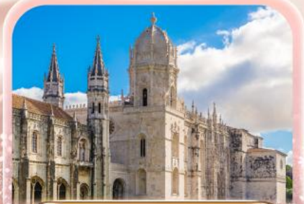
มหาวิหารเจโรนิโม